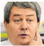
Vojtěch Filip předseda KSČM